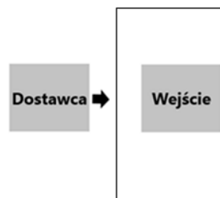
Rysunek 2. Fragment schematu z dostawcą i wejściem do procesu

Zacznę od fragmentu pokazującego, co powinno się wydarzyć przed rozpoczęciem procesu, aby mógł się on rozpocząć zgodnie z założeniami.