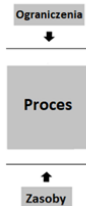
Rysunek 3. Fragment schematu z procesem, ograniczeniami oraz zasobami

Największy bloczek na schemacie to PROCES. Symbolizuje on wszystkie działania podejmowane w celu wytworzenia produktu procesu. Działania te nazywane są również KROKAMI PROCESOWYMI.