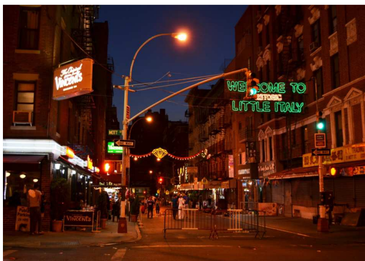
Fot. 1. 2012 r. – Little Italy w Nowym Jorku

W Stanach Zjednoczonych termin „enklawa” został zaadoptowany do określania zjawisk możliwych do wydzielenia w przestrzeni społecznej miasta i znalazł zastosowanie dla opisu takich „małych światów”, jak Little Italy , Little Havana czy Chinatown , które miały cechy etnicznie jednorodnych i ekonomicznie autonomicznych społeczności (Wilson, Martin, 1982). Później rozszerzono zakres znaczeniowy terminu także na mniejszości wyróżnione na podstawie stylu życia, statusu majątkowego lub kombinacji różnych cech, wskazując na istnienie w nich różnorodnych nieekonomicznych i nieetnicznych powiązań (Abrahamson, 1996: 1–2) oraz dobrowolność segregacji (Varady, 2005, vii).