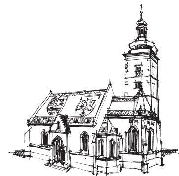
► Kościół św. Marka, rys. W. Kwiecień-Janikowski

Po wschodniej stronie placu znajduje się siedziba chorwackiego parlamentu (Sabor), wzniesiona w 1910 r. na miejscu barokowych budowli z XVII i XVIII w. To właśnie tutaj w 1918 r. z balkonu tego niepozornie wyglądającego piętrowego budynku w stylu secesyjnym, ogłoszono