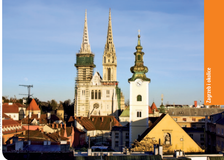
Katedra Wniebowzięcia NMP