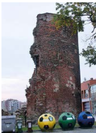
▲ Baszta Pod Zrębem

Do bastionu przylega Brama Nizinna , jedna z nowożytnych bram miejskich Gdańska. Została wzniesiona w 1626 r.