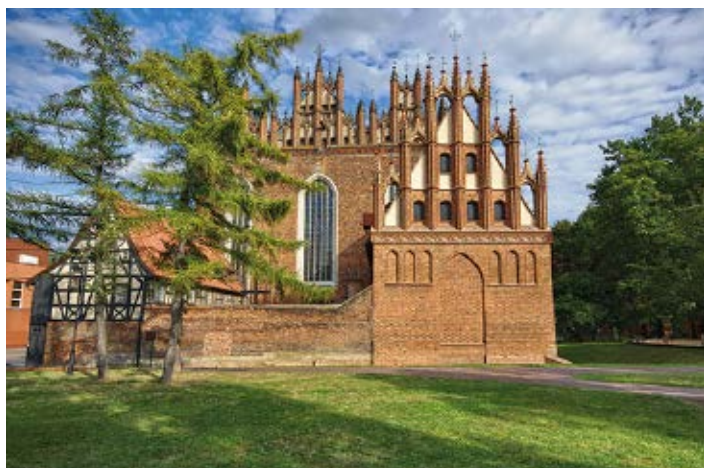
▲ Kościół św. Trójcy

Budynek wzniesiono pod koniec XIX w. w stylu neorenesansowym. Pierwotnie była to szkoła średnia dla dziewcząt, która swą nazwę zawdzięczała matce