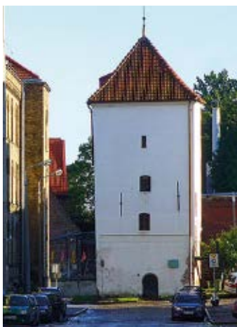
▲ Baszta Biała

wzniesiono Małą Zbrojownię projektu Jerzego Strakowskiego. Budynek miał służyć za magazyn ciężkich dział i moździerzy dla sąsiadujących umocnień. W przypominającym spichlerz obiekcie gromadzono żelazne i spiżowe działa (hala na parterze) oraz pistolety i strzelby (piętro). Na ścianie zewnętrznej zachował się piękny detal ozdobny przedstawiający herb Gdańska. Mała Zbrojownia jest dziś siedzibą Wydziału Rzeźby gdańskiej ASP.