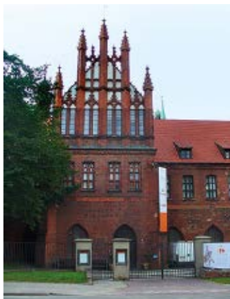
▲ Muzeum Narodowe

Tuż obok, w późnogotyckim klasztorze franciszkańskim zaaranżowanym na placówkę wystawienniczą, mieści się siedziba Muzeum Narodowego